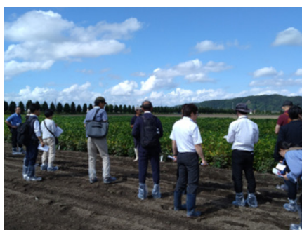
中央農試作物開発部道満研究主任の説明