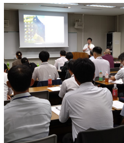
中央農試藤田作物開発部 長のご挨拶