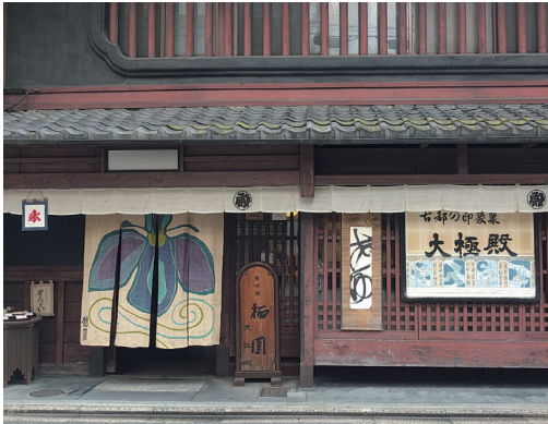
六角通高倉東入ル「大極殿本舗 六角店」