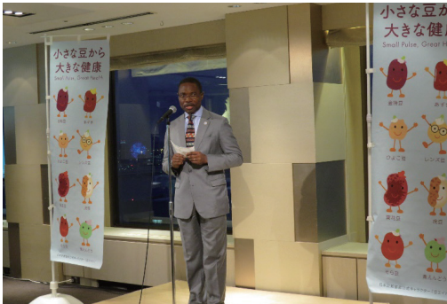
FAO駐日連絡事務所ポリコ所長挨拶