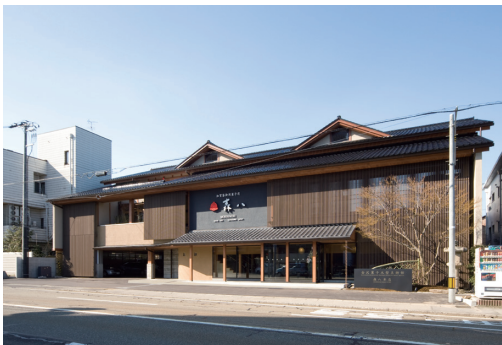
金沢城址、兼六園近くにある森八本店