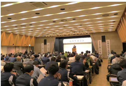
豆作り講習会の状況（石狩会場）