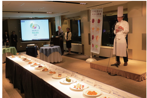
展示された豆料理