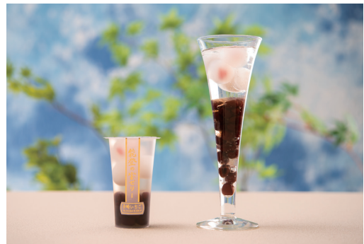
能登の宝ゼリー。右の「赤崎いちご」には3Lサイズの能登大納言が使われている