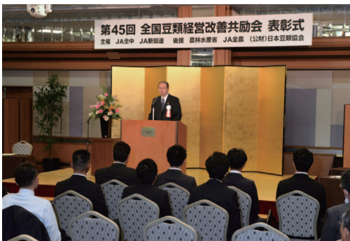
奥野全中会長による主催者挨拶