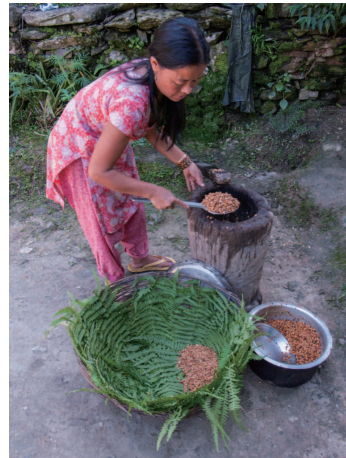
シダを敷いた竹カゴで納豆を仕込む（インド・東シッキム州アホ村）