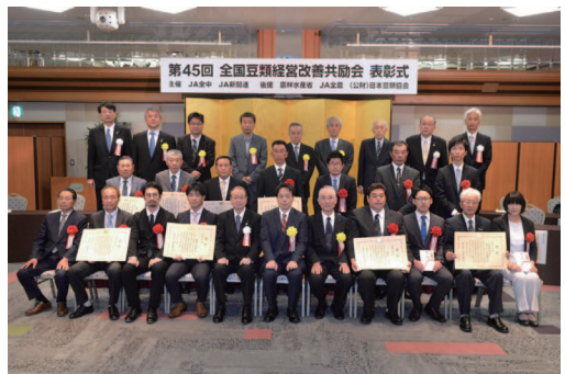
表彰式関係者記念撮影