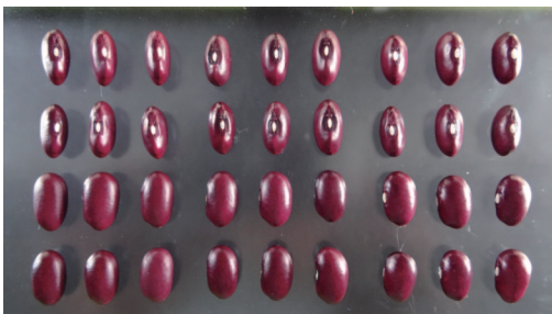
「福勝」（左）、「十育B81号」（中央）、「大正金時」（右）の子実