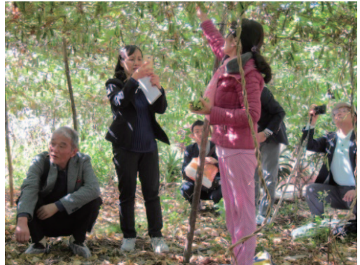
ダラットのライマメの棚の下の状況