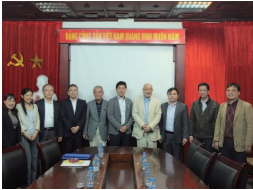
ハノイの会議室にて