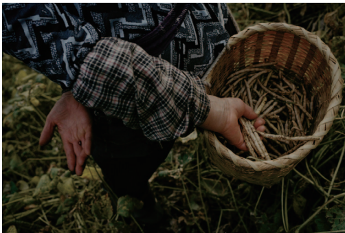
思い出深い小豆畑