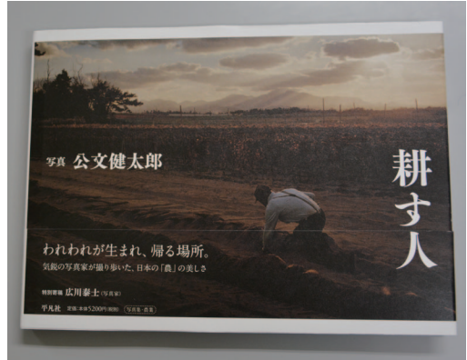
公文さんの最新写真集『耕す人』