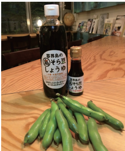
喜界島在来そら豆と「島そら豆しょうゆ」