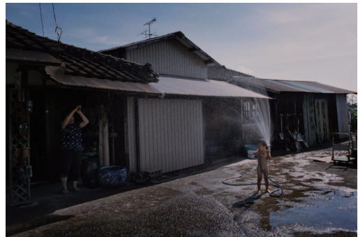
撮影で親しくなったレンコン農家の庭先で