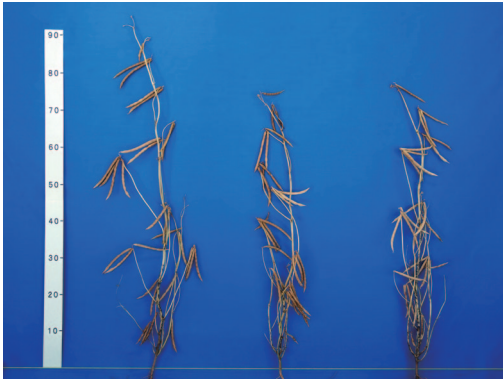
「サホロショウズ」(左)、「ちはやひめ」(中央)、「きたろまん」(右)の草本