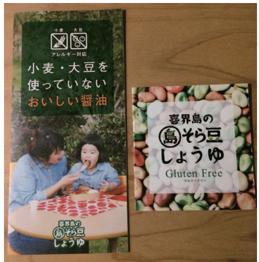
「島そら豆しょうゆ」のパンフレット