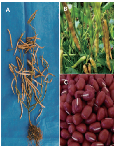
「美方大納言」小豆の草姿 (A)、 着莢状態 (B)、子実 (C)