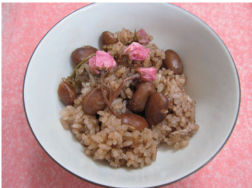
金時豆と桜塩漬炊き込みごはん