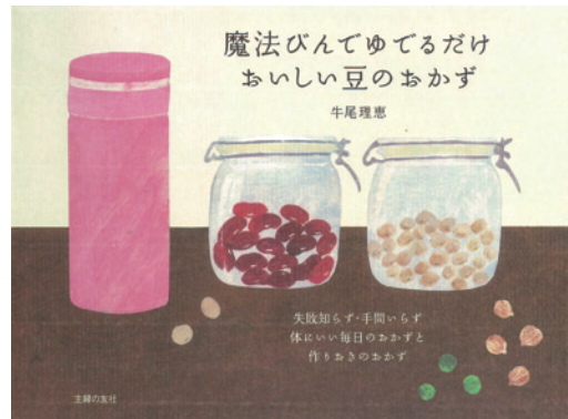
牛尾さんの著書『魔法びんでゆでるだけ おい しい豆のおかず』