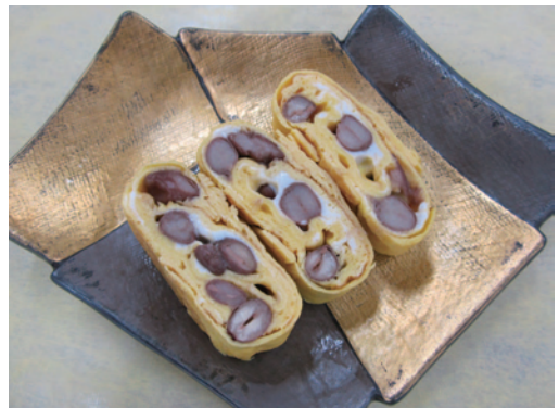
金時豆の伊達巻きたまご