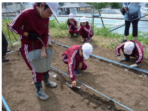
赤飯に使う小豆は自分たちで育てたもの