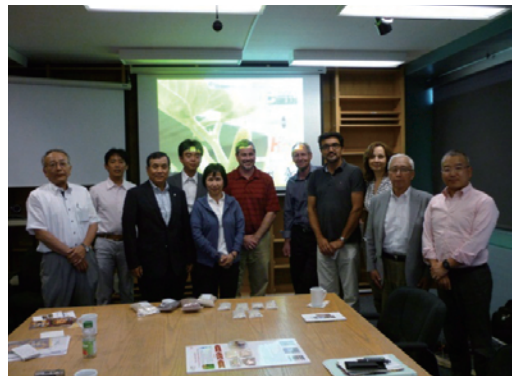
ゲルフ大学における意見交換