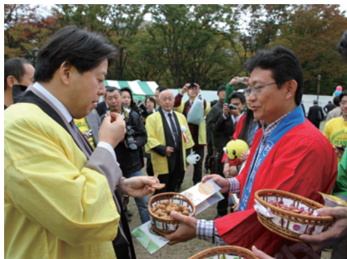
落花生を試食される林芳正農林水産大臣