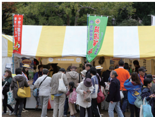
落花生の展示ブース