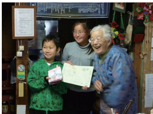
地域の独居老人に赤飯を届ける